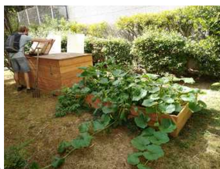
Rapport d'activité 2019 – association EISENIA