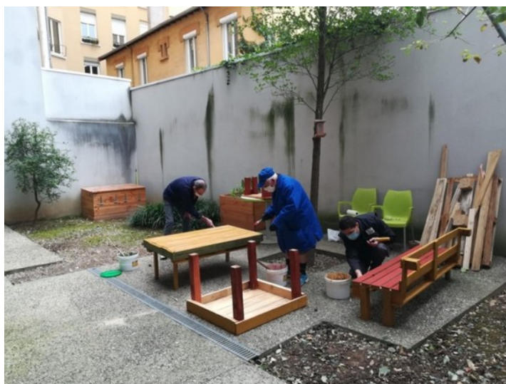
Peinture sur palettes, résidence Zola

Les actions d'Eisenia avec l'association Aralis ont débutées en 2020 sur les résidences de Pressensé, Zola et Les 4 chemins. Une formation concernant le cycle du vivant adaptée à chaque public (enfants/adultes) a été réalisée sur chaque site. Cette formation a permis aux résident.e.s et aux intervenantes sociales d'acquérir des connaissances en lien avec les activités proposées par l'association (lombricompostage, jardin partagé...). Les activités sur chaque site ont ensuite varié en fonction des besoins et des envies des habitant.e.s. Deux lombricomposteurs ont ainsi été construits, deux espaces potagers ont été créés. Nous avons également fabriqué des cendriers démocratiques, créé de la peinture naturelle ou encore construit des salons de jardin en palettes. Les retours sur ces actions ont été positifs. Les adultes et les enfants ont ainsi pu progresser en compétences manuelles à travers l'utilisation d'outils de construction (visseuse, scie circulaire...). Ces activités ont également favorisé la rencontre entre habitant.e.s, rompant l'isolement de certain.e.s des résident.e.s.