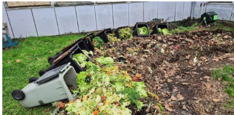
Notre andain aux serres pour la gestion des biodéchets des marchés du centre-ville