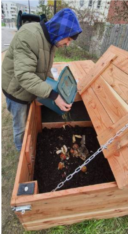
Construction de 2 lombricomposteurs à Brignais