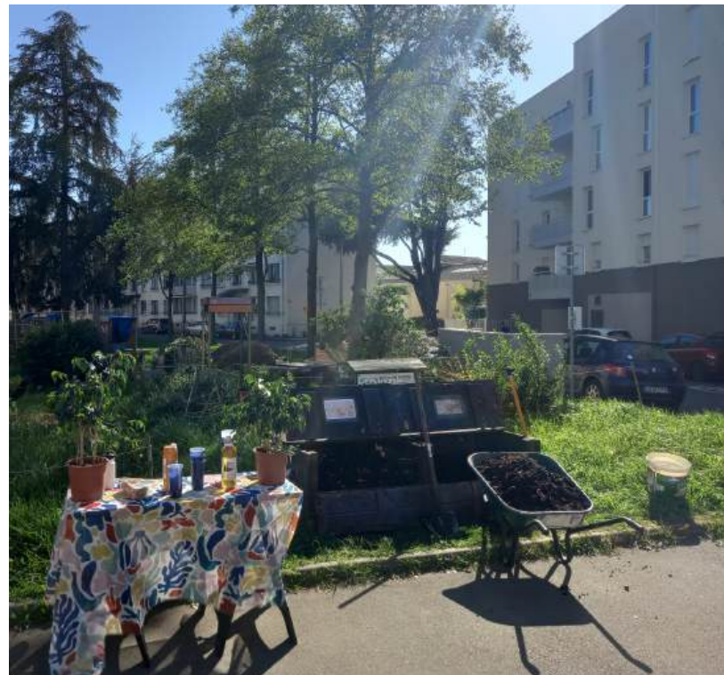
Goûter et distribution de lombricompost au Verger de Farge

Outre de nombreux projets de terrain et de recherches scientifiques sur le (lombri)compostage , Eisenia mène des projets, animations et formations sur d'autres sujets connexes : gestion et valorisation d'encombrants en pied d'immeuble, projet de reconditionnement d'ordinateurs , bricolage participatif , mise en place de jardins et aménagements pour la biodiversité ... C'est ce panel d' actions variées , mais toutes tournées vers l' agro-écologie et/ou la valorisation des déchets , qui permet à Eisenia de créer des emplois ultra-locaux , ancrés dans le territoire.