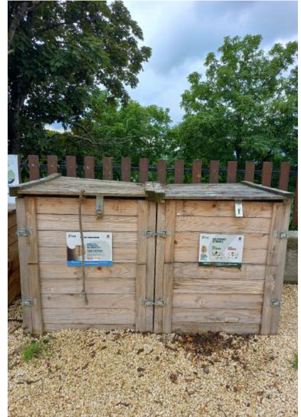
Suivi mensuel des composteurs de la SITOM