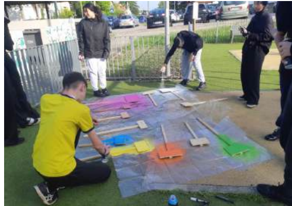
Rénovation de jardinières, plantation et création de panneaux à Grigny