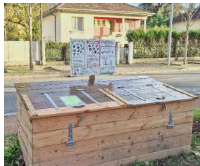
Nos lombricomposteurs de quartier

Cette gestion ultra-locale nous permet de pouvoir agir sur le gaspillage alimentaire en favorisant le glanage et le lien avec les associations de solidarité, comme le GEM et la Passerelle de l'Espoir .