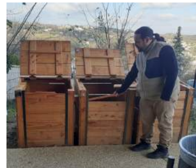
Suivi du composteur de la Rama